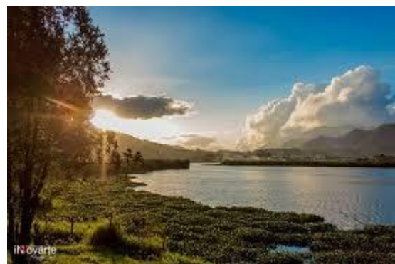
Atardecer en San Cristóbal